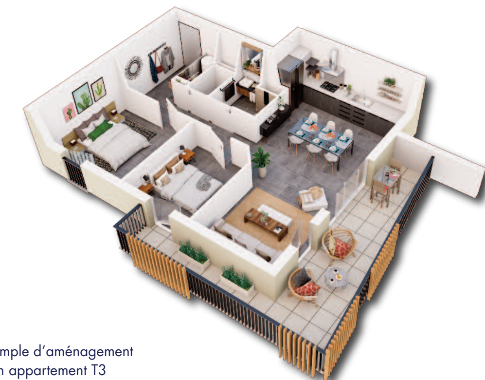
Exemple d'aménagement d'un appartement T3

Choisissez Le Jardin de Marius pour l'espace de vie et la qualité de réalisation de votre résidence.